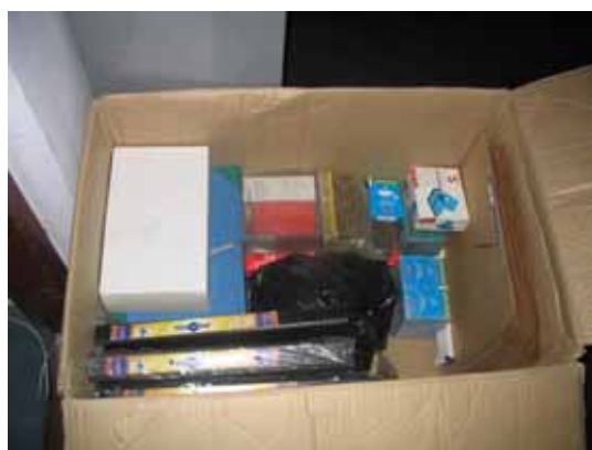
配布する文房具の一部

SVAが建設した学校校舎において、教室用の教材及び子どもたちへ文房具(基本的な筆記用具等)を配布します。教材、文房具の配布により学習環境が改善され、子どもたちの勉強に対する意識も向上します。この文房具配布により、学校2校分の教室、子ども用の文房具を配布することができます。教材、文房具の配布に関しては、ナンガハール州教育局や地域住民による全面的な協力の下、事業を行っております。