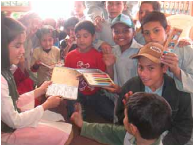
配布された色エンピツを手にした子ども達