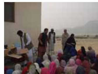
建設校舎竣工式にて 子どもたちに文房具を配布している様子