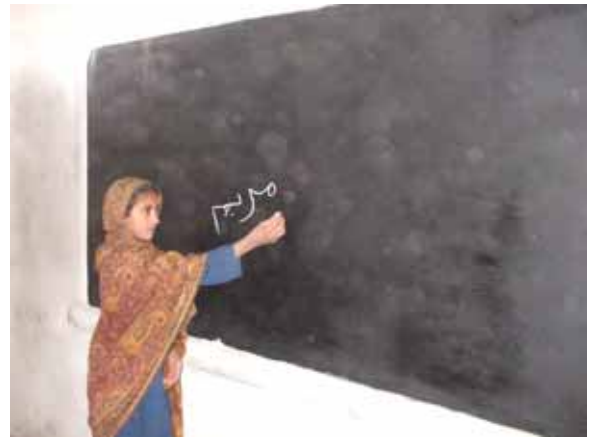
文房具は子ども達用と各教室用に配布します

困難な状況下でも “勉強をしたい”と いう子ども達の強い 思いは変わりませ ん。