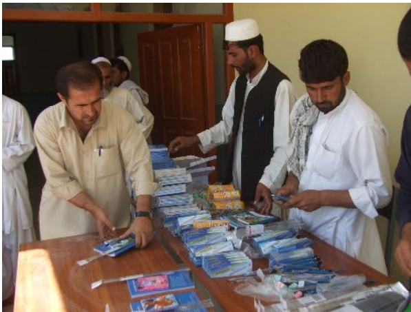
配布する文房具を準備するスタッフ

SVAが建設した学校校舎において、教室用の教材及び子どもたちへ文房具(基本的な筆記用具等)を配布します。教材、文房具の配布により学習環境が改善され、子どもたちの勉強に対する意識も向上します。教材、文房具の配布に関しては、州教育局や地域住民による全面的な協力の下、事業を行っております。