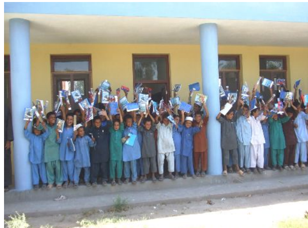
文房具を受け取った子どもたち