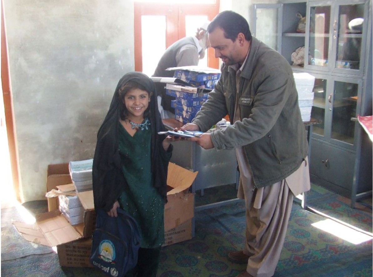
配布された文房具を手にする女の子(カイラアバッド小学校)

未だ戦争の爪痕が残るアフガニスタンでは学校校舎の絶対的な不足しており、既存校舎においても、戦争で破壊され修復が必要なものが多数あります。また、たとえ新しい校舎が建てられても、教員や子どもたちが使う教材や文房具が不足しているという学校が多数あります。