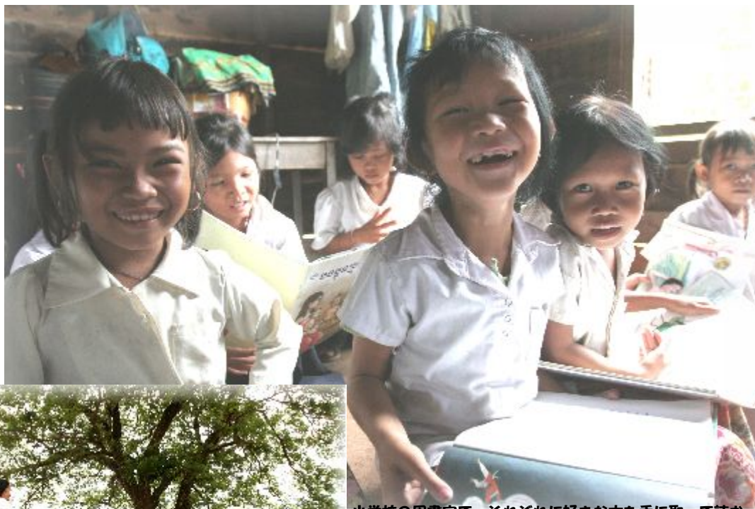
小学校の図書室で、それぞれに好きな本を手にとって読む