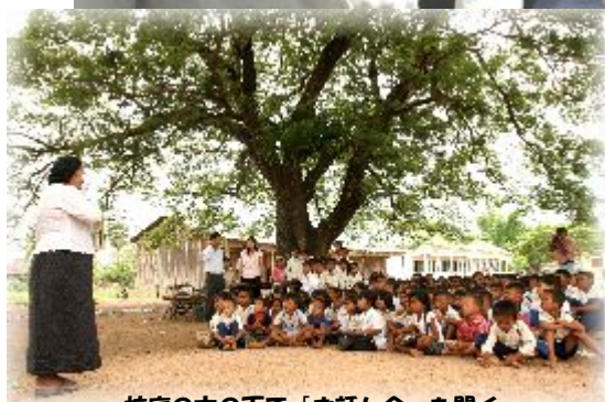
校庭の木の下で「お話し会」を開く