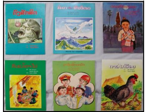
これまで出版した絵本の一部。