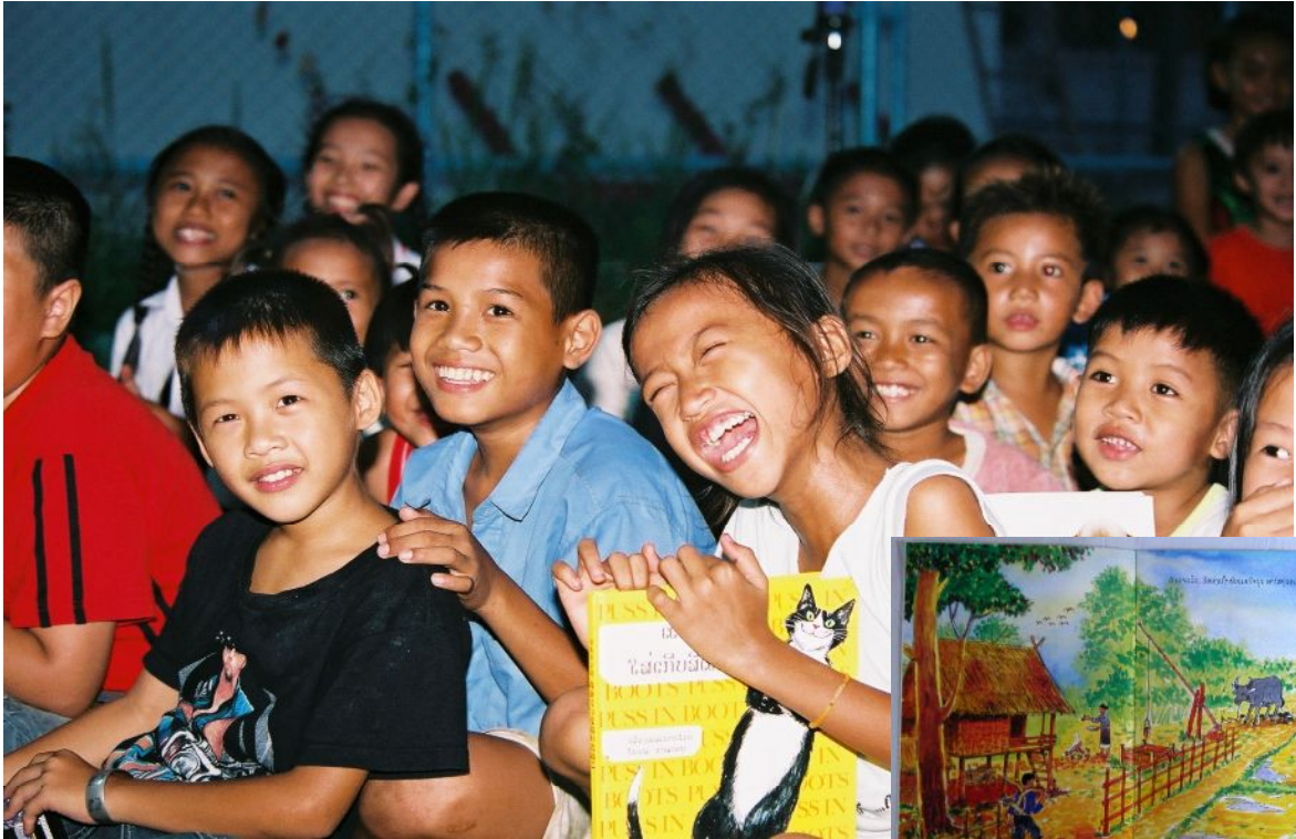
ストーリーテリングを楽しむ子どもたち(左)