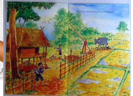
農村風景を描いた物語の1頁(右)

ラオスでは、1975年の社会主義革命時、旧王国時代の知識層が大量に海外流出し、同様に書物も大量に処分されました。現在も後発開発途上国を脱するべく、諸外国の援助を受けて経済社会開発を進めていますが、ラオスの出版文化は遅々とした状態が続いており、年間の出版件数も50タイトル前後、そのうち子ども向け絵本は数タイトルでしかありません。山の子どもには、絵本を見たことのない子どもたちがたくさんいます。