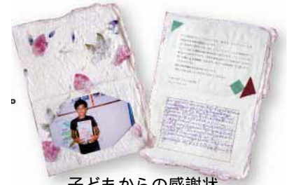
子どもからの感謝状