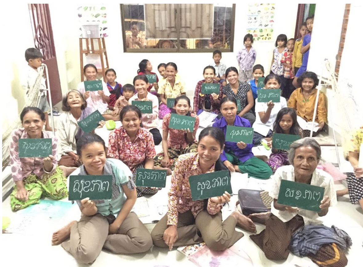
写真:コンポントム州ニーベック集合村のコミュニティ図書館識字教室にて

「薬品の注意書きが読めずに子どもに誤って農薬を飲ませてしまった」、「契約書が読めずに騙されてしまった」、「読み書き・計算ができればもっと暮らしが良くなる。大人だけど、勉強したい。」・・・ 貧困度の高い農村地域では、過去の戦乱から小学校や中学校教育を十分に受けられず、文字の読み書き・計算ができない人がたくさんいます。生活に困難を感じ貧困から抜け出せないでいる現状です。