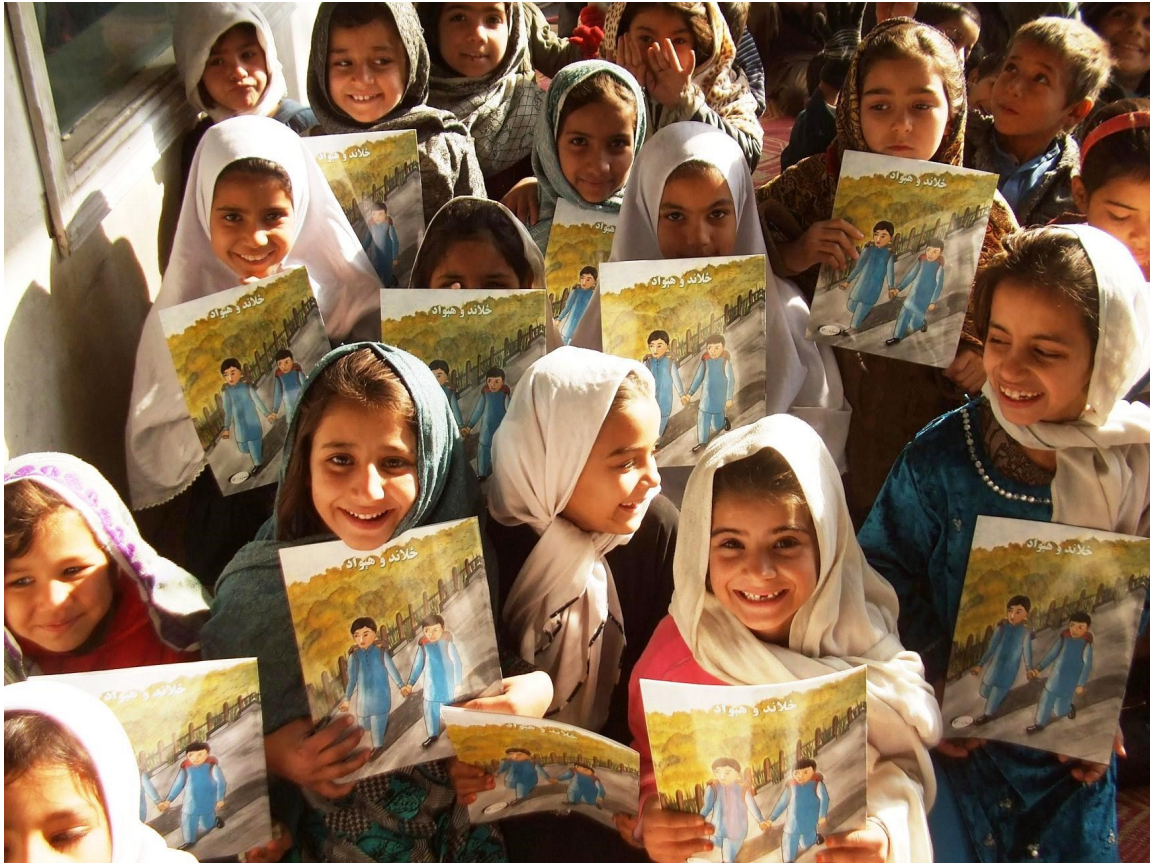
写真：出版絵本『ザランドとヒワド』と子どもたち

30年以上にわたる戦乱で、戦争しか知らない子どもたち。ようやく、国の復興へと歩みはじめており、教育分野の復興も進められています。