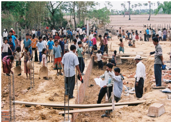
住民総出で行う基礎の「盛り土」作業

既存校舎で教室が足りていなかったり、老朽化のため危険な状況にある学校で、子どもたちは雨風や騒音の影響を受けながら勉強しています。シャンティは、電気がない地域にも対応できる遮光性に優れた風通しの良い校舎を建設します。学校建設地の選定は、州政府の教育局の情報をもとに、当会職員が候補地の村へ調査や確認のために何度も通います。また、村人自身が行政との連絡や建築の進み具合の確認、盛り土作業などに直接関わる「住民参加型」の学校建設を行っています。一緒に事業に参加してもらうことにより、建設完了後も住民が学校に愛着を持ち、維持管理してもらうことと、子どもたちの教育の大切さを再認識してもらうことを目指しています。