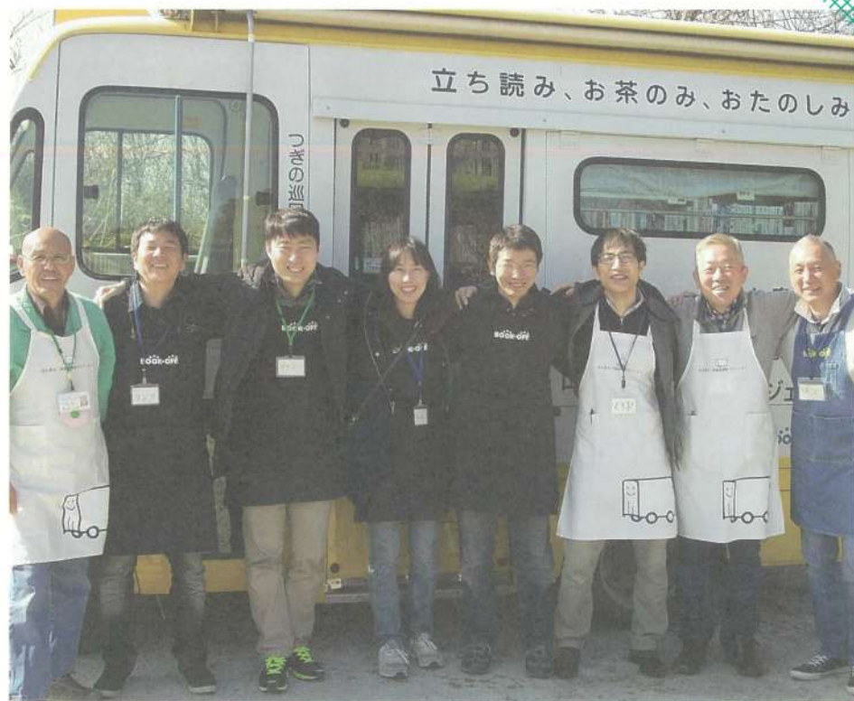
笑顔もつないで来ました