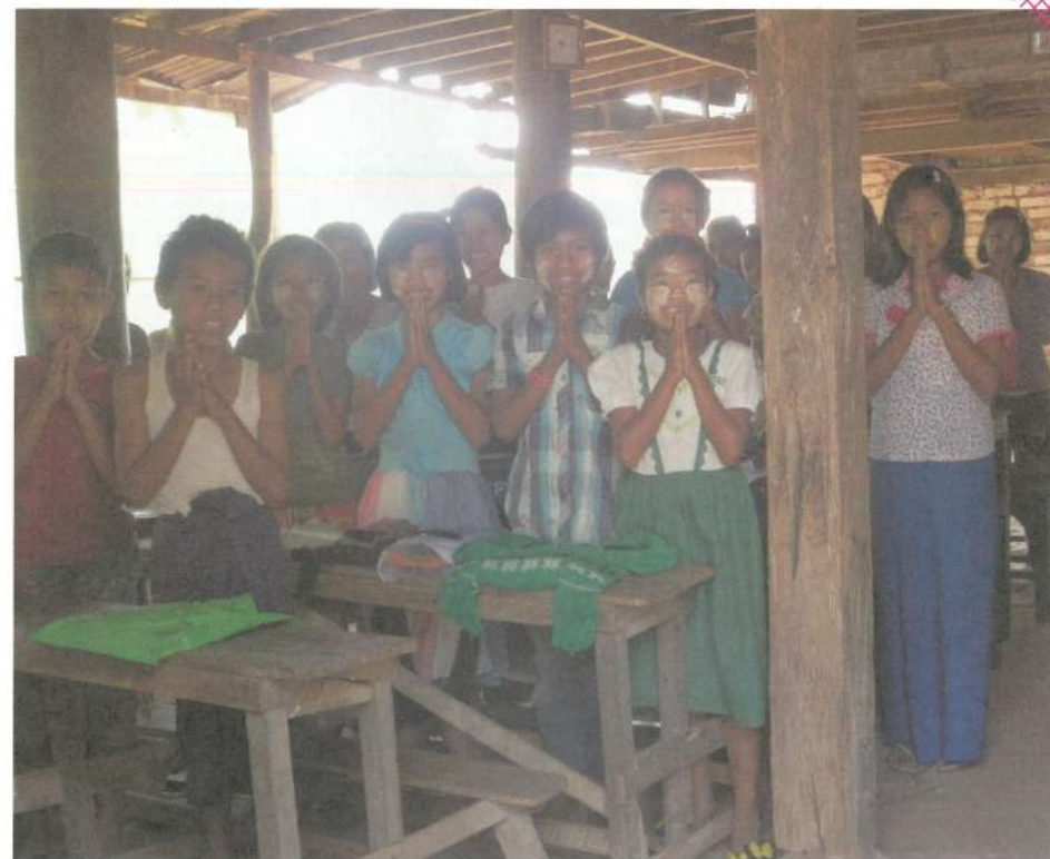
寺院学校建設開始に向けて地域と一丸に