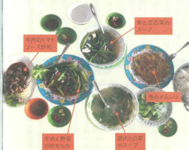
牛肉のトマト ソース炒め