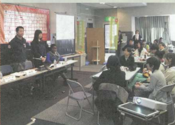
「市民防災世界会議」で活動を紹介する気仙沼事務所職員

3月18日、第3回国連防災世界会議は、2030年までの国際的な防災指針「仙台防災枠組」を採択し、閉幕しました。 防災の取り組みのなかで、①犠牲者数、②被災者数、③経済的な被害額、④病院や教育施設など重要インフラ損害数、⑤防災計画導入国数 ⑥防災における開発途上国への支援（国際協力）、⑦災害への早期警戒・リスク情報へのアクセス、の7目標を各国が達成することが合意されました。 住民や市民団体や行政などが一丸となって災害への備えに取り組めるよう、災害リスクの開示を求めると共に、交渉中に起こった防災をめぐる途上国支援における各国の対立を、災害大国である日本がリードすることが期待されます。 シャンティも東日本大震災、原発事故の被害を経験した国民として、市民の声を指針に反映させる提言活動をはじめ、被災者としての経験を通じて得た教訓を海外の人たちと共有し、災害に強い社会づくりにつ